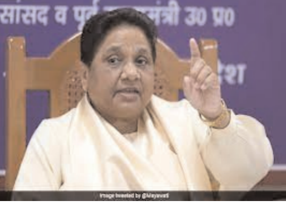
लेकिन वर्तमान में यह होता हुआ दिखाई नहीं दे रहा है। केंद्र और राज्य सरकार धर्म और संस्कृति की आड़ में राजनीति कर रही है। इससे लोकतंत्र कमजोर हो रहा है। इस दौरान मायावती ने समाजवादी पार्टी के राष्ट्रीय अध्यक्ष अखिलेश

यादव पर भी निशाना साधा। बसपा सुप्रीमो ने कहा कि विपक्ष के इंडिया गठबंधन को लेकर सपा मुखिया अखिलेश यादव ने बसपा के लोगों को सतर्क रहना होगा। बसपा प्रमुख मायावती ने कहा कि पिछले महीने मैंने आकाश आनंद को अपना एकमात्र उत्तराधिकारी घोषित किया था जिसके बाद मीडिया में यह अटकलें लगाई जा रही थी कि मैं जल्द ही राजनीति से संन्यास लेने वाली हूँ। मैं बताना चाहती कि इन अटकलों में रती धर भी सच्चाई नहीं है। मैं अंतिम सांस तक बसपा को मजबूत करने का काम करती रहूंगी। उन्होंने कहा कि इबीएम में धांधली की खबरें मिल रही हैं। विदेशों की तरह यहां भी यह व्यवस्था खत्म हो सकती है। इसमें बदलाव ही हो सकता है तब बसपा का वोट प्रतिशत भी बढ़ जाएगा। बसपा प्रमुख मायावती ने कहा कि मुझे राम मंदिर पर प्राण प्रतिष्ठा समारोह का निमंत्रण मिला है, मैंने इसपर कोई फैसला नहीं लिया है