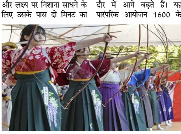
समय होता है। जो लोग दोनों तीरों से लक्ष्य पर प्रहार करते हैं वे दूसरे दशक की शुरुआत का है। क्योटो को क्योटो शासनकाल

क्योटो (जापान)। जापान के पश्चिमी प्रांत यमाशिरो की राजधानी क्योटो में प्रसिद्ध बौद्ध मंदिर संजूसो-गो-घो में वार्षिक नववर्ष तीरंदाजी टूर्नामेंट (जापानी में क्योटो) का आयोजन किया गया। इसमें लगभग 1700 युवाओं ने हिस्सा लिया। इनमें युवतियों की संख्या अधिक रही। जापानी समाचार पत्र जापान टुडे की रिपोर्ट के अनुसार, प्रतिभागियों को 60 मीटर दूर एक मीटर चौड़े लक्ष्य पर निशाना लगाना होता है। तीरंदाज समूहों में लक्ष्य को तीर से भेदते हैं। प्रत्येक तीरंदाज को दो तीर दिए जाते हैं