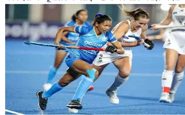
गोल किया। भारत ने आक्रामक खेल खेलते हुए 12 वें मिनट में