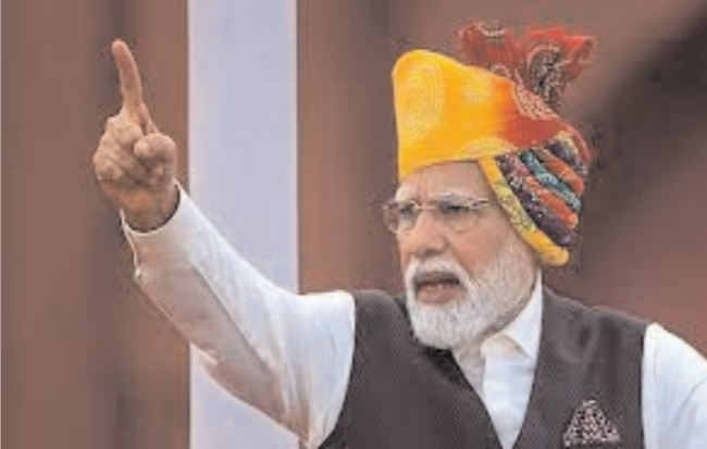
योजना-ग्रामीण के लाभार्थियों को 540 करोड़ रुपये की पहली किस्त जारी की गई। इस दौरान लाभार्थियों ने रसोई गैस कनेक्शन, बिजली, पाइप से पानी और आवास सहित अन्य सरकारी योजनाओं का लाभ उठाने के बाद अपने

जीवन में आए सकारात्मक बदलावों के बारे में बताया। प्रधानमंत्री ने संबोध के दौरान कहा, 'हमारी सरकार का प्रयास है कि कोई भी उसकी कल्याणकारी योजनाओं से वंचित नहीं रहे।' अयोध्या में 22 जनवरी को होने वाले राम मंदिर के प्राण प्रतिष्ठा समारोह का उल्लेख करते हुए मोदी ने कहा कि इन दिनों उन्होंने भी 11 दिन व्रत-अनुष्ठान का एक संकल्प किया हुआ है। इस दौरान वे श्री राम का ध्यान और स्मरण कर रहे हैं। उन्होंने कहा, 'जब आयु प्रभु राम का स्मरण करेंगे तो माता शबरी की याद आना बहुत स्वाभाविक है। श्रीराम की कथा माता शबरी के बिना संभव ही नहीं है। उन्होंने कहा कि अयोध्या से जब राम निकले थे तब तो वह राजकुमार थे। लेकिन राजकुमार राम, मर्यादा पुरुषोत्तम के रूप में हमारे सामने आए क्योंकि माता शबरी हो, केवट हो, निषाद राज हो... न जाने कौन-कौन से लोग... जिनके सानिध्य ने राजकुमार राम को प्रभु राम बना दिया। प्रधानमंत्री ने कहा कि सरकार की योजनाएं अति पिछड़े जनजातीय लोगों तक पहुंचने, यही पीएम-जनमन महाअभियान का उद्देश्य है। उन्होंने कहा, 'सरकार पूरी ताकत लगा रही है कि हमारे अति पिछड़े जनजातीय भाई-बहनों तक सरकार की हर योजना जल्द से जल्द पहुंचे।