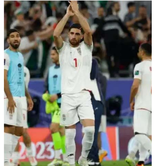
टीम हो सकते हैं। मैं आश्चर्यचकित हूँ कि वे इतना अच्छा खेले। एक अन्य एशियाई शानदार जीत के साथ अपने एफसी एशियाई कप अभियान की शुरुआत की।

खिलाफ खेल रहा हूँ, इसलिए मुझे पता है कि वे कितने अच्छे