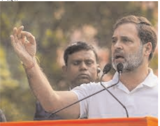
कई लोगों को कतार में खड़े देखा गया। इनमें महिलाएं और बच्चे भी शामिल रहे। स्थानीय लोगों ने राहुल गांधी के साथ-साथ कांग्रेस का

से मिले और उनकी समस्याओं के बारे में जानकारी ली। कांग्रेस नेताओं की बस जब व्यस्त इलाकों से गुजर रही थी तो यात्रा मार्ग पर भी जयकारा लगाया। मणिपुर से यात्रा शुरू करने के मकसद पर राहुल गांधी ने कहा, कांग्रेस पूर्व से पश्चिम तक यात्रा करना चाहती थी। पार्टी ने फैसला लिया कि मणिपुर से यात्रा की शुरुआत करने पर बेहद शक्तिशाली संदेश जाएगा। भारत के दूसरे राज्यों में भी लोगों को पता चलना चाहिए कि मणिपुर के लोग किस कठिन दौर से गुजर रहे हैं। लोगों को मणिपुर की जनता के संघर्ष के बारे में पता लगना चाहिए। राहुल के मुताबिक पिछले साल बेहद सफल रही- भारत जोड़ो यात्रा के दौरान कांग्रेस ने लगभग चार हजार किलोमीटर की पदयात्रा की। उन्होंने कहा कि मणिपुर की जनता ने जयशंकर का सामना किया है। स्थानीय जनता से मुखातिब कांग्रेस सांसद राहुल गांधी ने कहा, अपने परिवार के सदस्यों को खोया है। संपत्ति का भी बड़ा नुकसान हुआ है। मैं चाहता हूँ कि आपको