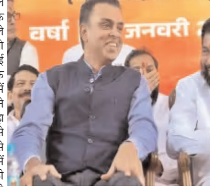
कोशिशें कीं। उन्होंने कुछ दिन पहले दिल्ली जाकर आलाकमान से चर्चा करने की कोशिश की थी। लेकिन उन्हें मिलने का समय नहीं दिया गया। इससे पार्टी से उनकी नाराजगी बढ़ गई। माना जा रहा है कि बंटवारे में दक्षिण मुंबई सीट उद्धव की शिवसेना के

सीट से जीते, लेकिन साल 2014 में मोदी लहर के बाद वह लगातार दो बार चुनाव हार गए। सूत्र बताते हैं कि दक्षिण मुंबई लोकसभा सीट को कांग्रेस की उम्मीदवारी को लेकर मिलिंद देवड़ा ने काफी खाली में जाते देख मिलिंद देवड़ा ने नई राजनीतिक पार्टी खेलने का फैसला किया। उधर, शिवसेना के दो फाड़ होने के बाद उद्धव की तो ताकत आधी हो गई है। जाहिर है कि इससे आगामी लोकसभा चुनाव में उद्धव की शिवसेना को वह लाभ नहीं मिल पाएगा, जो 2014 और 2019 में भाजपा के साथ रहते हुए मिला था। इस बीच, दो बार चुनाव हारने के बाद भी मिलिंद देवड़ा के जनाधार में कोई कमी नहीं आई है। दक्षिण मुंबई जिला कांग्रेस कमिटी के अध्यक्ष से लेकर अधिकांश कार्यकर्ता और पूर्व पार्षद मिलिंद के साथ हैं, जो शनिवार को उनके साथ शिंदे की शिवसेना में शामिल हुए हैं। आर, दक्षिण मुंबई से उम्मीदवारी मिली तो मिलिंद को इसका लाभ मिल सकता है। मुंबई कांग्रेस में देवड़ा परिवार का प्रभुत्व है। पूर्व केंद्रीय मंत्री मुरली देवड़ा करीब 25 साल तक मुंबई कांग्रेस के अध्यक्ष रहे। मुरली देवड़ा के पास कांग्रेस पार्टी की बड़ी जिम्मेदारी थी। दक्षिण मुंबई से मिलिंद देवड़ा दो बार सांसद रहे, तो उनके पिता मुरली देवड़ा दो बार इन्हें सीट का प्रतिनिधित्व किया है। पिता के बाद बेटे मिलिंद देवड़ा ने पार्टी के लिए अहम भूमिका निभाई।