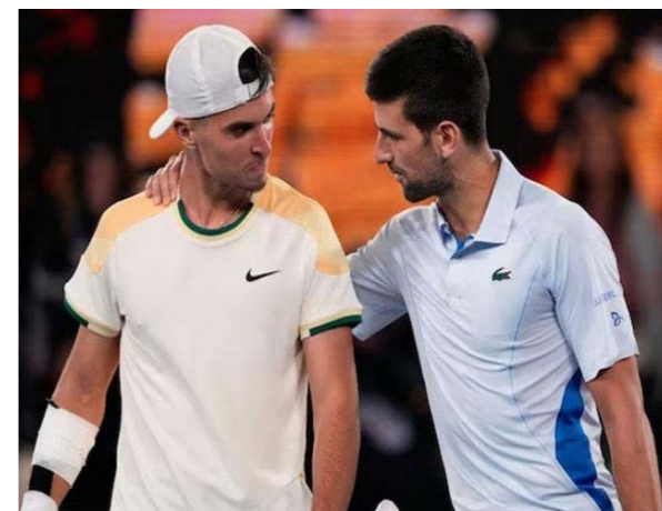
है जिसकी बराबरी शायद ही कोई खिलाड़ी कर सके। वह यहां के अनुरूप हुआ लेकिन दूसरे सेट में प्रिजमिच ने बराबरी

जोकोविच ने आस्ट्रेलियाई ओपन में ऐसा रिकॉर्ड बना दिया