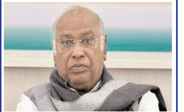
कहा, हम मोदी सरकार से तीन सवाल पूछना चाहते हैं। 2013 की तुलना में आदिवासियों के खिलाफ 48.15 फीसदी अपराध क्यों बढ़ गए? भाजपा की डबल इंजन सरकार वन अधिकार अधिनियम, 2006 को लागू करने में पूरी तरह से विफल क्यों रही? मोदी सरकार के आदिवासी मामलों के मंत्रालय, खासतौर से कमजोर जनजातियों समूहों के लिए विकास योजना के बजट में लगातार गिरावट क्यों आई? उन्होंने कहा, यह बजट साल 2018-19 में 250 करोड़ रुपये था और 2023 में घटकर यह 6.48 करोड़ रुपये रह गया है।

नई दिल्ली, 15 जनवरी। कांग्रेस प्रमुख मल्लिकार्जुन खरगे ने आदिवासी योजनाओं को लेकर सोमवार को केंद्र सरकार को निशाने पर लिया। उन्होंने कहा कि नरेंद्र मोदी सरकार चुनावी मौसम में आदिवासी समुदाय को ठगने की कोशिश कर रही है। उन्होंने 2013 की तुलना में आदिवासियों के खिलाफ बढ़ती अपराध दर पर भी सवाल उठाया। उन्होंने संसदीय समिति का हवाला दिया और कहा कि भाजपा की डबल इंजन सरकार वन अधिकार अधिनियम, 2006 को लागू करने में विफल रही है। खरगे ने आदिवासी समुदाय को लेकर सरकार से तीन सवाल पूछे और उनसे जुड़े प्रमुख मुद्दों पर जवाबदेही की मांग की। उन्होंने सोशल मीडिया प्लेटफॉर्म एक्स पर एक पोस्ट में लिखा, दस साल बाद अब जब चुनाव हो रहे हैं तो प्रधानमंत्री ने आदिवासियों और जनजातियों के कल्याण को याद आ रही है। उन्होंने