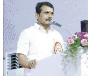
विक्रम नाथ की अध्यक्षता वाली बेंच ने टिप्पणी की कि यदि परिस्थितियां ऐसी आवश्यक हों तो संवैधानिक न्यायालय को स्वतंत्र जांच का निर्देश देने का अधिकार है। उन्होंने कहा, 'हमें किसी अर्जी की जरूरत नहीं है। यह इस बात पर निर्भर करता है कि अदालत क्या सोचती है।' सुप्रीम कोर्ट ने याचिका पर विचार करने से इनकार करते हुए कहा, 'हम विशेष अनुमति याचिका (एसएलपी) पर विचार करने के इच्छुक नहीं हैं।'