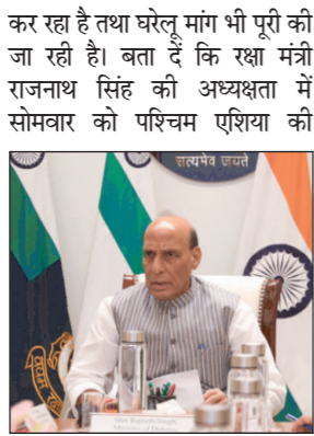
स्थिति पर गठित मंत्रियों के अनौपचारिक समूह की पांचवीं बैठक आयोजित हुई। बैठक में बताया गया

एजेंसी नई दिल्ली। भारत में ईंधन, यानी पेट्रोल-डीजल व गैस, का पर्याप्त भंडार है। देश में फिलहाल 60 दिनों का कच्चा तेल भंडार, 60 दिनों का प्राकृतिक गैस भंडार, तथा 45 दिनों का रसोई गैस भंडार उपलब्ध है। साथ ही, देश का विदेशी मुद्रा भंडार 703 अरब डॉलर के मजबूत स्तर पर बना हुआ है। रक्षा मंत्री राजनाथ सिंह ने यह जानकारी दी। इसके साथ ही सरकार ने बताया कि भारत तेल शोधन करने वाला दुनिया का तीसरा सबसे बड़ा देश है और चौथा सबसे बड़ा पेट्रोलियम उत्पाद निर्यातक भी है। भारत वर्तमान समय में 150 से अधिक देशों को निर्यात