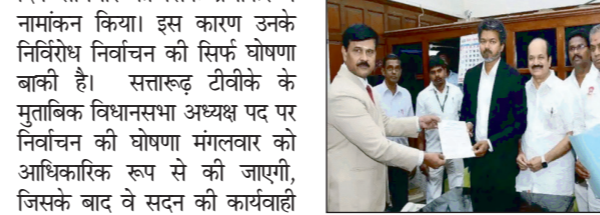
विश्वेश्वरों का मानना है कि प्रभाकर का निर्वाचन चुना जाना न केवल उनकी राजनीतिक स्वीकार्यता को दर्शाता है, बल्कि विधानसभा में मौजूदा संतुलन और सहमति की स्थिति को भी उजागर करता है। उनके अध्यक्ष बनने के बाद सदन की कार्यवाही अधिक व्यवस्थित, संतुलित और प्रभावी रूप से संचालित होने की उम्मीद जताई जा रही है।

एजेंसी चेन्नई। तमिलनाडु की 17वीं विधानसभा के अध्यक्ष पद पर तमिलनाडु केरु कडुगम (टीवीके) के विधायक जेसीडी प्रभाकर का निर्वाचन निर्वाचन तय है। विधानसभा अध्यक्ष पद के चुनाव में नामांकन दाखिल करने के अंतिम दिन सोमवार को सिर्फ प्रभाकर ने नामांकन किया। इस कारण उनके निर्वाचन की सिर्फ घोषणा बाकी है। सत्तारूढ़ टीवीके के मुताबिक विधानसभा अध्यक्ष पद पर निर्वाचन की घोषणा मंगलवार को आधिकारिक रूप से की जाएगी, जिसके बाद वे सदन की कार्यवाही के संचालन की अपनी जिम्मेदारी सभालेंगे। इसी क्रम में विधानसभा उपाध्यक्ष पद के लिए तुरंत विधानसभा क्षेत्र के विधायक विश्वेश्वर के नाम पर भी सहमति बन गई है। ऐसी उम्मीद है कि विधानसभा अध्यक्ष के निर्वाचन की घोषणा के बाद उपाध्यक्ष पद पर विश्वेश्वर के नाम की घोषणा भी कर दी जाएगी। 173 वर्षीय प्रभाकर एक अनुभवी राजनेता हैं। उन्होंने इसी वर्ष जनवरी में टीवीके प्रमुख जोसेफ