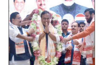
उपमुख्यमंत्री प्रेस्टन टेहनसोंग, नगालैंड के मुख्यमंत्री नेम्फू रियो एवं उपमुख्यमंत्री पवन कल्याण, मेघालय के मुख्यमंत्री कौनराड के संगमा एवं

इस अवसर पर असम में भाजपा और राजग के वृद्ध अध्यक्षों के साथ-साथ पंचायत स्तर पर निर्वाचित प्रतिनिधियों को भी आमंत्रित किया गया है, जिससे कार्यक्रम को व्यापक जनभागीदारी का स्वरूप मिला है।