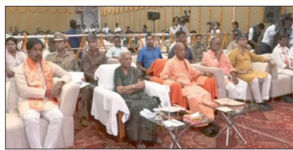
था। क्योंकि उन्हें यह भ्रम था कि मूर्तियों को खंडित करके इसके वैभव को लूट कर भारत की

एजेंसी वाराणसी। उत्तर प्रदेश के मुख्यमंत्री योगी आदित्यनाथ ने सोमवार को कहा कि 1000 वर्ष पूर्व विदेशी आक्रांता महमूद गजनवी सहित अन्य विदेशी आक्रांताओं ने सोमनाथ मंदिर पर 17 बार आक्रमण कर उसके वैभव को खंडित करने का प्रयास किया