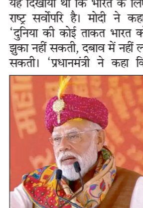
गुजरात के सोमनाथ मंदिर में आयोजित सोमनाथ अमृत महोत्सव को संबोधित करते हुए प्रधानमंत्री ने कहा कि 11 मई 1998 को भारत ने पोखरण में पहले तीन परमाणु परीक्षण किए थे और उसके बाद दुनिया भर की शक्तियों ने भारत पर विभिन्न प्रकार के प्रतिबंध लगाए थे। उन्होंने कहा, '11 मई के बाद दुनिया हम पर टूट पड़ी थी, लेकिन 13 मई को भारत ने दो और परमाणु परीक्षण किए। इससे दुनिया को पता चला कि भारत की राजनीतिक इच्छाशक्ति कितनी अटल है। उन्होंने कहा कि तत्कालीन प्रधानमंत्री अटल बिहारी वाजपेयी के नेतृत्व वाली सरकार ने

एजेंसी गिर सोमनाथा। प्रधानमंत्री नरेन्द्र मोदी ने सोमवार को यह कहा कि दुनिया की कोई भी ताकत भारत को झुका नहीं सकती और न ही उसे दबाव में ला सकती है। उन्होंने कहा कि 1998 के पोखरण परमाणु परीक्षणों ने दुनिया को भारत की अटल राजनीतिक इच्छाशक्ति का परिचय कराया था।