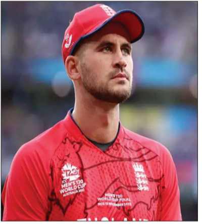
लगाकर 99 रन बनाए। हार्दिक 99 पर पहुंचकर आउट हो गये। साल 2024 में थाईलैंड के बैकॉक में

लंदन (एजेंसी)। टी20 अंतरराष्ट्रीय क्रिकेट जैसे छोटे प्रारूप में जहां कई खिलाड़ियों ने शतक लगाये हैं। वहीं कई खिलाड़ी ऐसे भी रहे हैं जो केवल एक रन से शतक नहीं लगा पाये हैं। टी20 अंतरराष्ट्रीय क्रिकेट में 99 पर आउट होने वाले पहले बल्लेबाज इंग्लैंड के आक्रामक सलामी बल्लेबाज एलेक्स हेल्स थे। साल 2012 में वेस्टइंडीज के खिलाफ खेले गए एक मुकाबले में हेल्स ने केवल 68 गेंदों में 99 रन बनाये। अपनी इस पारी में उन्होंने 6 चौके और 4 छक्के लगाये थे पर वह अपना पहला शतक पूरा नहीं कर पाये। रवि रामपाल की एक गेंद पर वह आउट हो गये। वह टी20 अंतरराष्ट्रीय में 99 पर आउट होने वाले पहले खिलाड़ी रहे हैं।