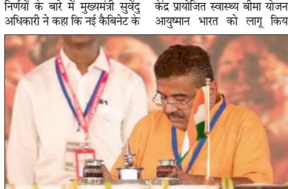
गठन के 45 दिनों के भीतर बीएसएफ को जमीन सौंपने का वादा भाजपा के संकल्प पत्र में किया गया था और गृह मंत्री अमित शाह ने भी इसकी घोषणा की थी। बैठक के बाद मीडियाकर्मियों से बात करते हुए

मुख्यमंत्री ने कहा, 'नई कैबिनेट की पहली बैठक में इस फैसले को मंजूरी दे दी गई।' बैठक में पारित दूसरा महत्वपूर्ण निर्णय पश्चिम बंगाल में केंद्र प्रायोजित स्वास्थ्य बीमा योजना आयुष्मान भारत को लागू किया