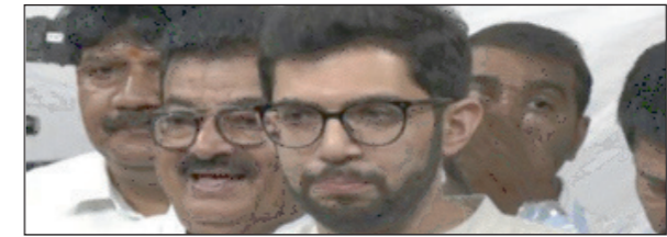
दूसरी राजनीतिक राह चुनी है। उन्होंने पत्रकारों से बात करते हुए कहा कि जिन सांसदों ने पाला बदला है, उन्हें अपने पद से इस्तीफा देकर जनता के बीच दोबारा जाना चाहिए। आदित्य ठाकरे ने चुनौती देते हुए कहा कि यदि वह भारतीय जनता पार्टी (भाजपा) के समर्थन और नेतृत्व में चुनाव लड़ना चाहते हैं, तो जनता का सामना करें।

उनका दावा था कि उनकी पार्टी ने लोगों का विश्वास और दिल जीता है तथा जनता चुनाव के जरिए अपनी