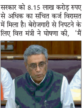
सरकार को 8.15 लाख करोड़ रुपए से अधिक का संचित कर्ज विरासत में मिला है। बेरोजगारी से निपटने के लिए वित्त मंत्री ने घोषणा की, 'मैं