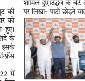
शामिल हुए। उद्धव के बेटे आदित्य ठाकरे ने झूठे लिखा- पार्टी छोड़ने वाले सांसदों ने साबित कर दिया है कि उनकी वफादारी बिकाऊ है। कम से कम यह मान लीजिए कि लालच की वजह से आपने रातोरात बिना किसी शर्म के यह सब छेड़ दिया। 6 सांसदों के शामिल होने के

मुंबई । महाराष्ट्र में उद्धव ठाकरे गुट की शिवसेना के 9 में से 6 सांसद सोमवार को एकनाथ शिंदे की शिवसेना में शामिल हुए। बागी सांसदों ने उपमुख्यमंत्री एकनाथ शिंदे के साथ उनके नंदनवन बंगले पर बैठक की। इसके बाद बागी सांसदों ने शिंदे के साथ प्रेस कॉन्फ्रेंस करके पार्टी बदलने का ऐलान किया। इस दौरान शिंदे ने कहा- जब 2022 में हमने पार्टी और धनुष-बाण बचाने के लिए विद्रोह किया था, तब 40 विधायक थे और अब छक्के लग चुके हैं। हमारी लड़ाई बालासाहेब के विचारों को बचाने के लिए है, इसीलिए आज ये 6 सांसद बालासाहेब की असली शिवसेना में