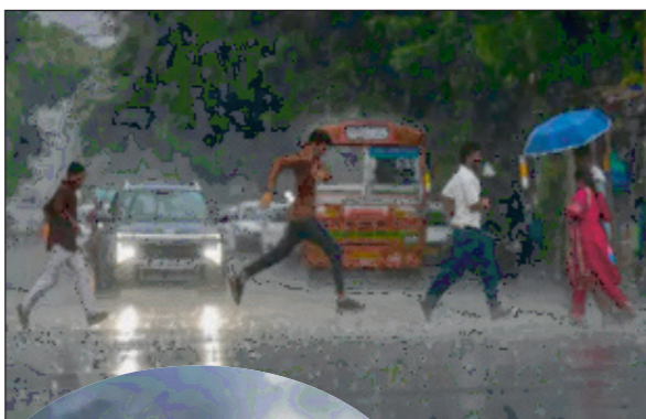
बारिश हुई, उतनी जोधपुर-बोकारने में 6 महीने में होती है। राजस्थान के श्रीगंगानगर में ओले गिरे। वहीं, एमपी के 5 जिलों में आज हीटवेव का अलर्ट है। उत्तर प्रदेश के 38 जिलों में लू चल सकती है।

भोपाल/जयपुर/लखनऊ/पटना । 15 दिन से छत्तीसगढ़ बॉर्डर पर अटके मानसून की देवाड़ा के रास्ते में राज्य में एंटी हो गई है। बंगाल की खाड़ी में बने सिस्टम ने मानसून को आगे बढ़ने में मदद की है। इसके साथ ही बस्तर सभाग में तेज बारिश का अलर्ट जारी कर दिया गया है। अगले कुछ दिनों में यह राज्य के बाकी जिलों को भी कवर कर लेगा। तमिलनाडु के थूथुकोडी में बवंडर आया। पहले इसे टॉरनेडो बताया गया था। लेकिन दृष्टि ने सोमवार को पुष्टि करते हुए कहा कि थूथुकोडी को घटना लोकल कन्वेक्टिव वॉर्टेक्स यानी धूल का बवंडर थी। मेघालय में भारी बारिश हुई। खासी हिल्स जिले के मासिनाराम में 24 घंटे में 530 मिमी बारिश दर्ज की गई। यानी एक रात में यह जितनी