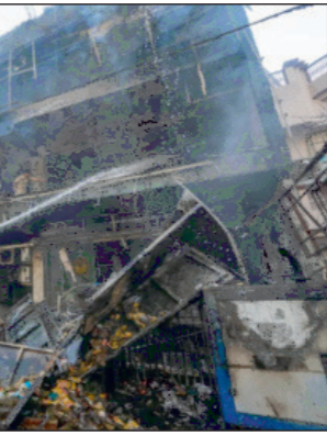
घोषणा की है। उधर रक्षामंत्री एवं राजधानी के सांसद राजनाथ सिंह भी लखनऊ के लिए रवाना हो गए हैं।

लखनऊ । अलीगंज स्थित एक बिल्डिंग में आग लगने से कोचिंग पढ़ने व एपीएमएस कोर्स करने वाले