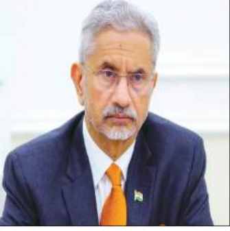
भारत की बढ़ती साझा और प्रभाव को भी रेखांकित करेगा, जिससे आने वाले समय में वैश्विक समीकरणों में भारत की भूमिका और अधिक महत्वपूर्ण हो सकती है।

जाएंगे। यहाँ वे तीसरी भारत-यूरोपीय संघ व्यापार एवं प्रौद्योगिकी परिषद (टीटीसी) की बैठक में भाग लेंगे और अपने यूरोपीय संघ तथा बेलजियम के समकक्षों के साथ महत्वपूर्ण बातचीत करेंगे। टीटीसी की शुरुआत 2022 में ऑर्टीफिशियल इंटेलिजेंस (एआई), क्वांटम कंप्यूटिंग, सेमीकंडक्टर और साइबर सुरक्षा जैसे महत्वपूर्ण तकनीकी क्षेत्रों में आदान-प्रदान को सुविधाजनक बनाने के उद्देश्य से की गई थी। यह परिषद भारत और यूरोपीय संघ के बीच रणनीतिक तकनीकी सहयोग को गहरा करने में महत्वपूर्ण भूमिका निभाती है, जिससे दोनों पक्षों को अत्याधुनिक प्रौद्योगिकियों के विकास और साझाकरण में लाभ मिल सके। जयशंकर का यह बहुआयामी दौरा न केवल द्विपक्षीय संबंधों को मजबूत करेगा, बल्कि वैश्विक कूटनीतिक पटल पर