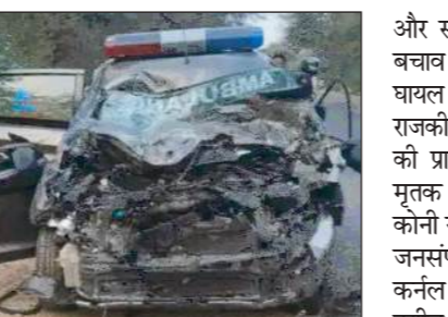
सूरतगढ़ सदर थाना क्षेत्र में 22 एलजीडब्ल्यू के पास हुआ। हादसे के तुरंत बाद स्थानीय लोग मौके पर पहुंचे और पुलिस को सूचना दी। सदर थाना पुलिस घटनास्थल पर पहुंची

एजेंसी श्रीगंगानगर(राजस्थान)। श्रीगंगानगर जिले के सूरतगढ़ क्षेत्र में आज सुबह नेशनल हाइवे-62 पर सेना के ट्रक और एक निजी एम्बुलेंस के बीच भिड़ंत हो गई। हादसे में एम्बुलेंस के परखच्चे उड़ गए। दुर्घटना में एम्बुलेंस में सवार तीन लोगों की मौत पर ही मौत हो गई, जबकि दो अन्य गंभीर रूप से घायल हो गए। हादसे के बाद हाइवे पर अफरा-तफरी मच गई और कुछ समय के लिए यातायात प्रभावित रहा। यह हादसा