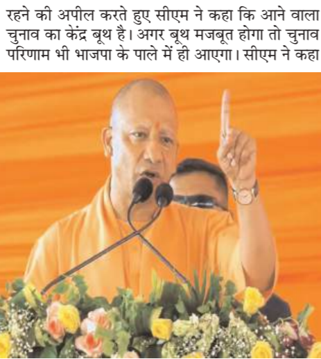
कि जब शक्ति केंद्र मजबूत होगा तो बंगाल जैसी जीत मिलने में कोई कठिनाई नहीं होगी। जिस बंगाल को चुसपैठ का अड्डा बना दिया गया था, अराजकता थी और

लखनऊ। शक्ति केंद्र संयोजकों को संबोधित करते हुए मुख्यमंत्री योगी आदित्यनाथ ने भी श्रीराम मंदिर प्रकरण पर विपक्ष को जमकर घेरा। उन्होंने कहा कि ये वही लोग हैं, जिनकी आस्था तब आहत नहीं होती है, जब कारसेवकों पर गोली चलती है। इसने सावधान रहने की जरूरत है। उन्होंने कहा कि ये वही लोग हैं, जो अपने वोटबैंक के लिए लैंड व लव जिहाद का समर्थन करते हैं। उन्होंने तीखा हमला बोलते हुए कहा कि बाबरी ढांचा का समर्थन करने वालों को अब भारत की आस्था की चिंता नहीं है। इन्हें तो बस अपने वोट बैंक की चिंता है। मुख्यमंत्री ने कहा कि सरकार के विकास के मॉडल की वजह से ही सपा और कांग्रेस पीड़ित है। उन्हें इसी बात से चिंता है कि जिन लोगों को जातियों में बाँटकर उनका हक मारते थे, उनका अब विकास हो रहा है। ये अब देश की आस्था पर प्रहार कर रहे हैं। सारी ऊर्जा वहीं लगा रहे। शक्ति केंद्र के संयोजकों को विपक्ष के भ्रमजाल से सतर्क