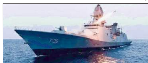
घरेलू औद्योगिक पारिस्थितिकी तंत्र को परिपक्वता को उजागर करता है, संयंत्र से संचालित महेन्द्रगिरी को

'उच्च गति-उच्च धीरज' बहुमुखी प्रतिभा और बहुआयामी समुद्री संचालन के लिए डिजाइन किया गया है। जहाज का हथियार सूट विश्वस्तरीय है, जिसमें सुपरसोनिक सतह से सतह पर मार करने वाली मिसाइलें, मध्यम दूरी की सतह से हवा में मार करने वाली मिसाइलें और एक विशेष पनडुब्बी रोधी युद्धक सूट है। इन प्रणालियों को अत्याधुनिक कॉम्बैट मैनेजमेंट सिस्टम के माध्यम से मूल रूप से एकीकृत किया गया है, जिससे चालक दल सटीकता के साथ खतरों का जवाब दे सकता है। स्टेल्थ फ्रिगेट का लचीला मिशन प्रोफाइल इसे उच्च-तीव्रता वाले मुकाबले से लेकर मलक्का स्ट्रेट, हिंद महासागर में लगातार अपनी मौजूदगी बनाए रखती है। जब भी कोई संकट आता है, चाहे वह निकासी ऑपरेशन हो या मानवीय सहायता देना हो, हमारी नेवी हमेशा सबसे आगे रहती है।