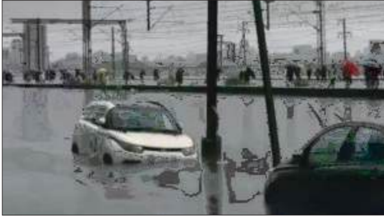
फडणवीस ने कहा कि प्रशासन अलर्ट पर है। अपील की। वहीं, रविवार को तेज हवाओं के उन्हेने लोगों से बेवजह यात्रा नहीं करने की

एजेंसी मुंबई । देश के कई राज्यों में मानसून ने रफ्तार पकड़ ली है। महाराष्ट्र में तीन दिन से लगातार बारिश हो रही है। मुंबई-पुणे रेल रूट पर करजत-लोनावला के भार घाट सेक्शन में दो जगह लैंडस्लाइड हो गईं। तीनों रेलवे लाइनें प्रभावित हो गईं। 20 ट्रेनों को कैसिल करना पड़ा। उधर, मुंबई-पुणे एक्सप्रेसवे पर भी लैंडस्लाइड होने से रास्ता बंद हो गया। मुंबई में कल से 75kmph की रफ्तार से हवाएं चल रही हैं, 142 पेड़ उखड़ गए। मुंबई में बारिश के कारण महाराष्ट्र विधानसभा की कार्यवाही स्थगित मुंबई और आसपास के इलाकों में भारी बारिश के रेड अलर्ट को देखते हुए महाराष्ट्र विधानसभा की सोमवार की कार्यवाही पूरे दिन के लिए स्थगित कर दी गई। मुख्यमंत्री देवेंद्र