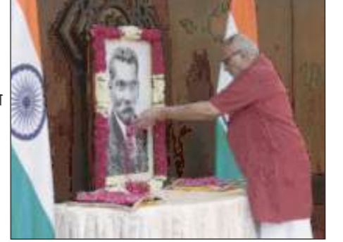
उपराष्ट्रपति सीपी राधाकृष्णन ने उपराष्ट्रपति भवन में समाज सुधारक रेड्मलाई श्रीनिवासन की जयंती के अवसर पर उन्हें पुष्पांजलि अर्पित की। उपराष्ट्रपति राधाकृष्णन ने एक्स पर कहा, 'रेड्मलाई श्रीनिवासन ने अपना जीवन छुआछूत जैसी सामाजिक बुराई से लड़ने के लिए समर्पित कर दिया और उनका यह दृढ़ विश्वास था कि प्रत्येक व्यक्ति का आत्मसम्मान और प्रतिष्ठा हमेशा कायम रहनी चाहिए।' तमिलनाडु के चेंगलपट्टु जिले में सात जुलाई 1860 को जन्मे रेड्मलाई श्रीनिवासन दलित अधिकार कार्यकर्ता, राजनेता और समाज सुधारक थे। उन्हें तमिलनाडु (तत्कालीन मद्रास प्रेसीडेंसी) में अनुसूचित जाति (विशेषकर परैयार समुदाय) के उत्थान का अग्रदूत माना जाता है। श्रीनिवासन ने अछूत माने जाने वाले समुदायों के बीच शिक्षा और अधिकारों के प्रति जागरूकता फैलाई।

एजेंसी नई दिल्ली। उपराष्ट्रपति सीपी राधाकृष्णन ने उपराष्ट्रपति भवन में समाज सुधारक रेड्मलाई श्रीनिवासन की जयंती के अवसर पर उन्हें पुष्पांजलि अर्पित की। उपराष्ट्रपति राधाकृष्णन ने एक्स पर कहा, 'रेड्मलाई श्रीनिवासन ने अपना जीवन छुआछूत जैसी सामाजिक बुराई से लड़ने के लिए समर्पित कर दिया और उनका यह दृढ़ विश्वास था कि प्रत्येक व्यक्ति का आत्मसम्मान और प्रतिष्ठा हमेशा कायम रहनी चाहिए।' तमिलनाडु के चेंगलपट्टु जिले में सात जुलाई 1860 को जन्मे रेड्मलाई श्रीनिवासन दलित अधिकार कार्यकर्ता, राजनेता और समाज सुधारक थे। उन्हें तमिलनाडु (तत्कालीन मद्रास प्रेसीडेंसी) में अनुसूचित जाति (विशेषकर परैयार समुदाय) के उत्थान का अग्रदूत माना जाता है। श्रीनिवासन ने अछूत माने जाने वाले समुदायों के बीच शिक्षा और अधिकारों के प्रति जागरूकता फैलाई।