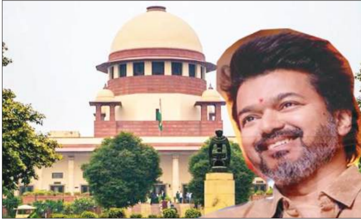
सकती है। यह लड़ाई कोर्ट के बाहर लड़ी जानी चाहिए। डीएमके ने याचिका दायित्व कर कहा था कि

नई दिल्ली (एजेंसी)। तमिलनाडु के करूर में रैली में हुए हादसे में 41 लोगों की मौत हो गई थी। यह मामला सुप्रीम कोर्ट तक पहुंच गया था। डीएमके ने मौजूदा टीवीके सरकार के खिलाफ याचिका दायित्व की थी। सीएम विजय हादसे के पीड़ित परिवारों से मिलकर उन्हें मुआवजा और नौकरी देने की बात कही है, डीएमके का कहना था कि सीएम विजय को रोकना चाहिए, लेकिन सुप्रीम कोर्ट ने डीएमके की याचिका को खारिज कर दिया है। मीडिया रिपोर्ट के मुताबिक सुप्रीम कोर्ट ने कहा कि हम किसी भी सीएम को गतिविधियों को तय नहीं करेंगे। जजों ने डीएमके के वकील से कहा कि वह कोर्ट को राजनीतिक लड़ाई का मंच न बनाएं। अगर सत्ताधारी टीवीके के नेता हादसे को लेकर बयान दे रहे हैं, तो डीएमके भी उसके जवाब में बयान दे