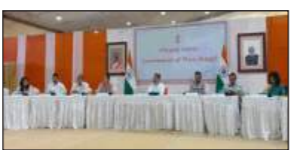
मुख्यमंत्री सुवेंदु अधिकारी ने पीड़ित परिवारों को सौंपे मुआवजा राशि के चेक

कोलकाता। पश्चिम बंगाल के मुख्यमंत्री सुवेंदु अधिकारी ने मंगलवार को तारातला गोदाम की छत गिरने से प्रभावित परिवारों के लिए राहत पैकेज की घोषणा की। इसमें आर्थिक मदद, रोजगार में सहायता, मुफ्त इलाज और पीड़ित परिवारों के बच्चों की पढ़ाई के लिए सहायता शामिल है। राज्य सचिवालय के नबन्ना सभागार में आयोजित कार्यक्रम में मुख्यमंत्री ने 24 जून को हुई दुर्घटना में जान गंवाने वाले 16 श्रमिकों के परिवारों को 10-10 लाख रुपये की आर्थिक सहायता के चेक सौंपे। वहीं हादसे में घायल लोगों को 1 लाख रुपये की वित्तीय सहायता दी गई। पीड़ित परिवारों से बात करते हुए अधिकारी ने उन्हें भरोसा दिलाया कि राज्य सरकार भविष्य में भी उनकी मदद करती रहेगी।