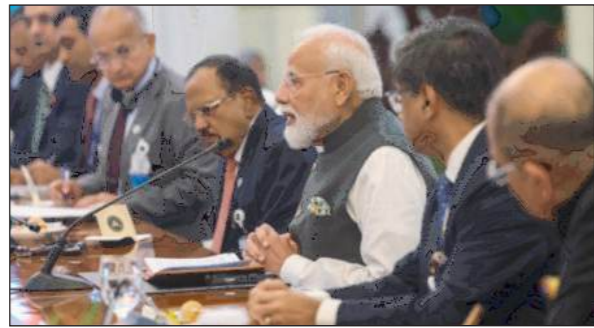
मानक नियंत्रण संगठन (सीडीएससीओ) और इंडोनेशिया की औषधि एवं खाद्य नियामक एजेंसी

लिए बाह्य अंतरिक्ष की खोज एवं उपयोग संबंधी सहयोग समझौते का विस्तार, भारत के केंद्रीय औषधि (बीपीओएफ) के बीच चिकित्सा उत्पादों के विनियमन में सहयोग, खनिज एवं इस्पात आपूर्ति श्रृंखला में संरक्षा सहयोग संबंधी समझौते का विस्तार, भारत के राष्ट्रीय आपदा प्रबंधन प्राधिकरण (एनडीएमए) और इंडोनेशिया की राष्ट्रीय आपदा प्रबंधन एजेंसी के बीच सहयोग, दूरसंचार प्रौद्योगिकी एवं सेवाओं, अनुसंधान, प्रौद्योगिकी एवं नवाचार तथा स्वास्थ्य कार्यबल सहयोग से जुड़े समझौतों पर भी हस्ताक्षर किए गए। दोनों देशों ने भारत के निर्वाचन आयोग (ईसीआई) और इंडोनेशिया के जनरल इलेक्शन कमिशन (केपीयू) के बीच सहयोग बढ़ाने पर भी सहमति जताई। रक्षा सहयोग को नई ऊंचाई देते हुए ब्रह्मोस मिसाइल प्रणाली पर सहयोग तथा एयर-टू-एयर मिसाइल सहयोग समझौता भी किया गया।