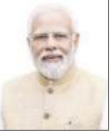
केंद्रीय सड़क परिवहन एवं राजमार्ग मंत्रालय के अनुसार, बैठक के दौरान गडकरी ने संबंधित परियोजनाओं के कार्यों की प्रगति की समीक्षा करते हुए सभी कार्यान्वयन एजेंसियों को आपसी समन्वय के साथ लंबित मुद्दों का शीघ्र समाधान करने के निर्देश दिए। उन्होंने कहा कि परियोजनाओं के निर्धारित लक्ष्य समय सीमा के भीतर पूरे किए जाएं ताकि जनता को जल्द से जल्द

एजेंसी नई दिल्ली। प्रधानमंत्री नरेंद्र मोदी ने आज सुबह एकसमूह बैठक पर एक सुभाषितम् साझा कर धैर्य के महत्व पर चर्चा की। उन्होंने कहा कि सब किसी भी देश की सबसे बड़ी ताकत है। यह देश को सबसे मुश्किल चुनौतियों के बीच भी एकजुट रहने और लगातार तरक्की, खुशहाली और आत्मनिर्भरता की ओर बढ़ने के लिए प्रेरित करता है। प्रधानमंत्री नरेंद्र मोदी ने कहा कि चलते हुए पहाड़ भी एक युग के आखिर में हवा से हिल सकते हैं। फिर भी, पक्के इरादे वाले का स्थिर मन मुश्किल हालात में भी कभी नहीं डगमगाता। यह सुभाषितम् इस प्रकार है, चलन्ति गिरयः कामं युगान्तपवनाहताः। कुच्छेऽपि न चलत्येव धीराणां निरचलं मनः। इसका अर्थ है- प्रलयकाल की भयंकर आंधी के प्रभाव से भले ही विशाल पर्वत भी अपनी जगह से हिलकर डगमगा जाएं, लेकिन गंभीर कठ्य या संकट आने पर भी धीर (वीर और समझदार) पुरुषों का मन अनेक संकल्प से कभी विचलित नहीं होता। यह श्लोक सीख देता है कि विकट परिस्थितियों में भी व्यक्ति को अपना मानसिक संतुलन और सत्य का मार्ग नहीं छोड़ना चाहिए।