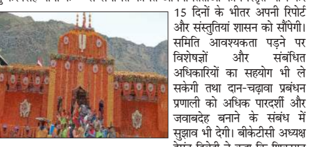
सामने आते ही संबंधित कर्मचारी से स्पष्टीकरण मांगा गया और जांच समिति गठित की गई। उन्होंने कहा कि समिति श्रद्धालुओं की आस्था और भगवान के चढ़ावे की पवित्रता के प्रति पूरी तरह प्रतिबद्ध है और भ्रष्टाचार या अनियमितता के मामलों में 'जीरो टॉलरेंस' की नीति अपनाती है। जांच में जो भी दोषी पाया जाएगा, उसके विरुद्ध कठोर विभागीय और विधिक कार्रवाई की जाएगी।