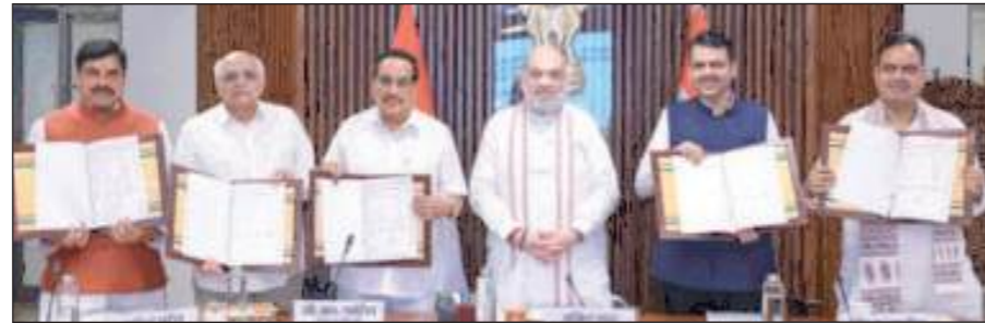
मध्य प्रदेश, गुजरात और राजस्थान को लाभ हुआ। बांध पूरा होने से इन दिखने में छोटा लग सकता है, लेकिन जिस भूमि तक नर्मदा का पानी पहुंचा मंत्री ने कहा, प्रधानमंत्री नरेंद्र मोदी के नेतृत्व में जल सुरक्षा को मजबूत

एजेंसी मुंबई। मुंबई मौसम विभाग ने अगले पांच दिनों के लिए महाराष्ट्र के मौसम का अनुमान जारी किया है। इसमें अगले पांच दिनों तक राज्य के अलग-अलग हिस्सों में गरज-चमक के साथ तूफानी बारिश की चेतावनी दी गई है। कुछ हिस्सों में हीट वेव की चेतावनी दी गई है। मौसम विभाग ने पालघर, नासिक घाट और पुणे घाट इलाकों के लिए रेड अलर्ट जारी किया था। इसी तरह मुंबई शहर, मुंबई के उपनगरों, सिंधुदुर्ग, रत्नागिरी, रायगढ़, कोल्हापुर घाट, अहिल्यानगर, धुले जलगांव, वाशिम और वर्धा, नागपुर के लिए येलो अलर्ट जारी किया गया था। जबकि ठाणे, रायगढ़, नासिक, नंदुरबार, बुलढाणा, अकोला, सतारा घाट और अमरावती के लिए ऑरेंज अलर्ट जारी किया गया था। मौसम विभाग ने लिए पालघर, नासिक घाट, रायगढ़, रत्नागिरी, कोल्हापुर घाट, बुलढाणा, अकोला, अमरावती और वर्धा में येलो अलर्ट और पुणे घाट, सतारा घाट इलाकों के लिए ऑरेंज अलर्ट जारी किया है। गुरुवार को रत्नागिरी, सतारा घाट, पुणे घाट, खंडला घाट, चंद्रपुर और गडचिरोली के लिए येलो अलर्ट जारी किया गया है। शुक्रवार के लिए वर्धा, चंद्रपुर, गडचिरोली और वतमाल जिले के लिए येलो अलर्ट रहेगा। शनिवार को अमरावती, वर्धा, नागपुर और चंद्रपुर के लिए येलो अलर्ट जारी किया गया है।