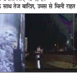
नागौर शहर और उसके आसपास के इलाकों में मौसम का मिजाज अचानक बदल गया। दोपहर बाद आसमान में घने काले बादल छा गए और कई हिस्सों में गरज-चमक के साथ तेज बारिश का दौर शुरू हुआ। इस बारिश से पिछले कुछ दिनों से पड़ रही तेज उमस और गर्मी से स्थानीय बाशियों को काफी राहत मिली है। किसानों के चेहरे भी इस मानसूनी बारिश को देखकर खिल उठे हैं।

स्थिति पर नजर बनाए हुए है और जलभराव वाले क्षेत्रों से पानी निकासी के प्रयास किए जा रहे हैं। नागौर : गरज के साथ तेज बारिश, उमस से मिली राहत