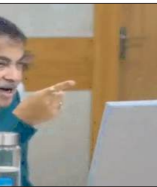
कृशल और भविष्य के अनुरूप बनाने में मदद मिलेगी। उन्होंने कहा कि केंद्र सरकार विकसित भारत के संर्पक व्यवस्था में बड़ी सुधार होगा। इससे यात्रा समय और लॉजिस्टिक लागत में कमी आएगी, व्यापार और आर्थिक गतिविधियों को गति मिलेगी तथा देश के सड़क अवसंरचना नेटवर्क को अधिक आधुनिक,

उनका लाभ मिल सके। उन्होंने कहा कि इन रणनीतिक राजमार्ग गलियारों के समय पर पूरा होने से क्षेत्रीय